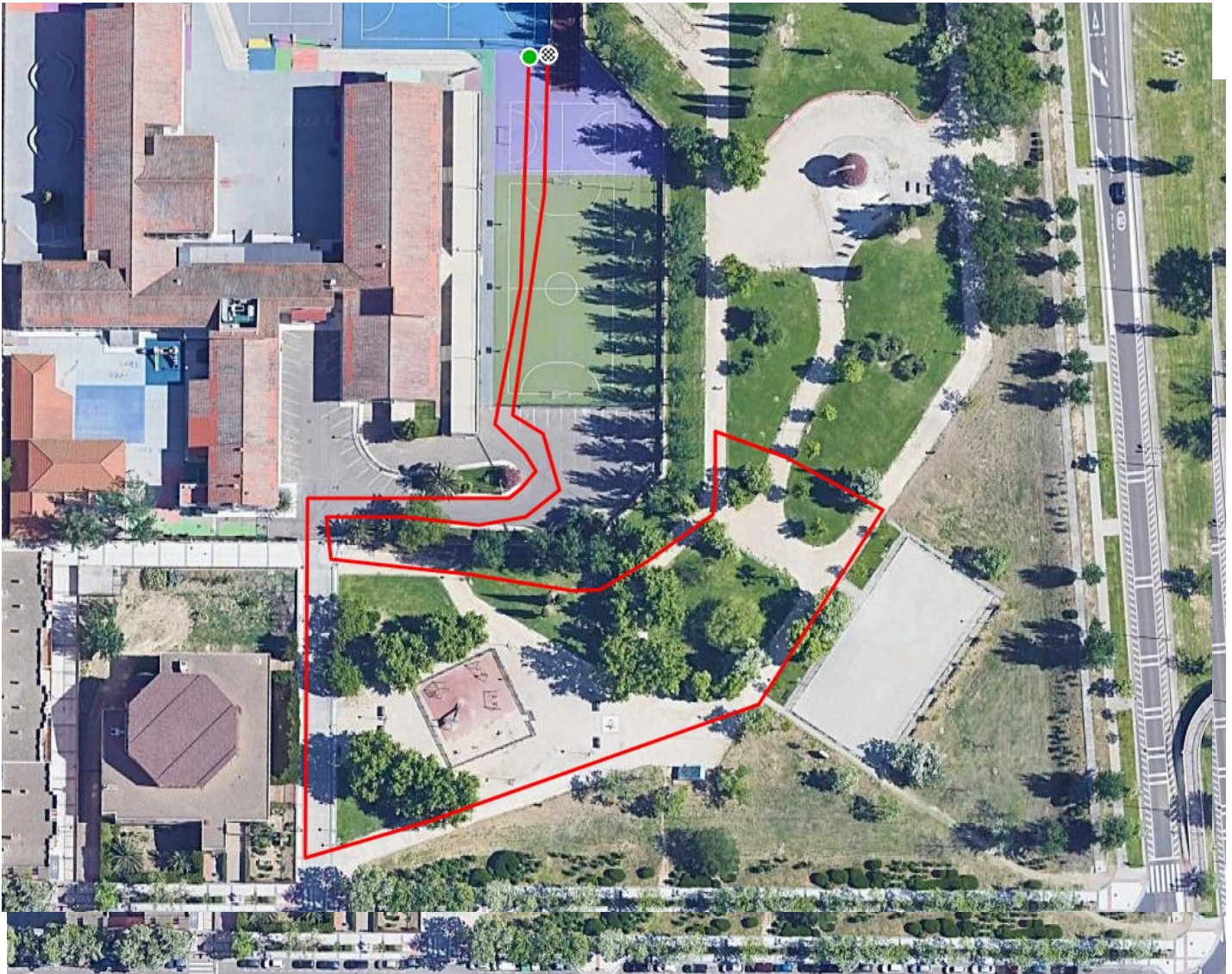
Vuelta A 500m (Wikiloc)