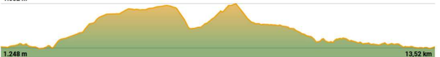
TABLA TÉCNICA VIII TRAMACASTILLA TRAIL DESAFÍO BARRANCO HONDO 13K