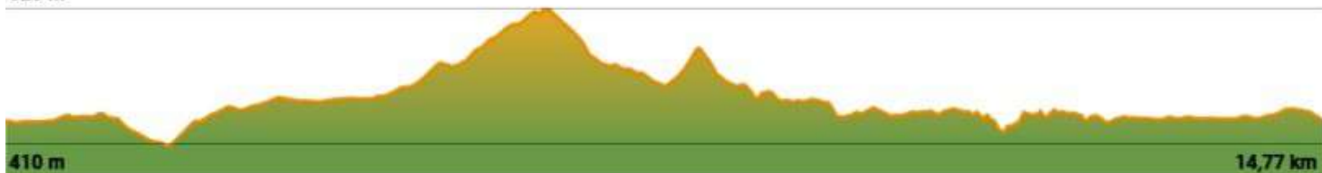
TABLA TÉCNICA XVI DESÉRTICA OLIVERA BELCHITE BY FARTLECK SPORT