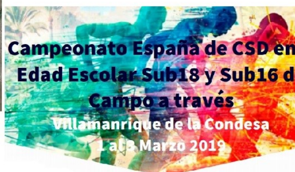
Anexo II Circuito

CIRCUITO Circuito A 1.000m Circuito B 2.000m Salida Meta Cámara de Llamadas